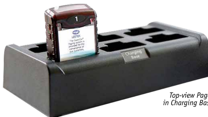
Top-view Pager in Charging Base